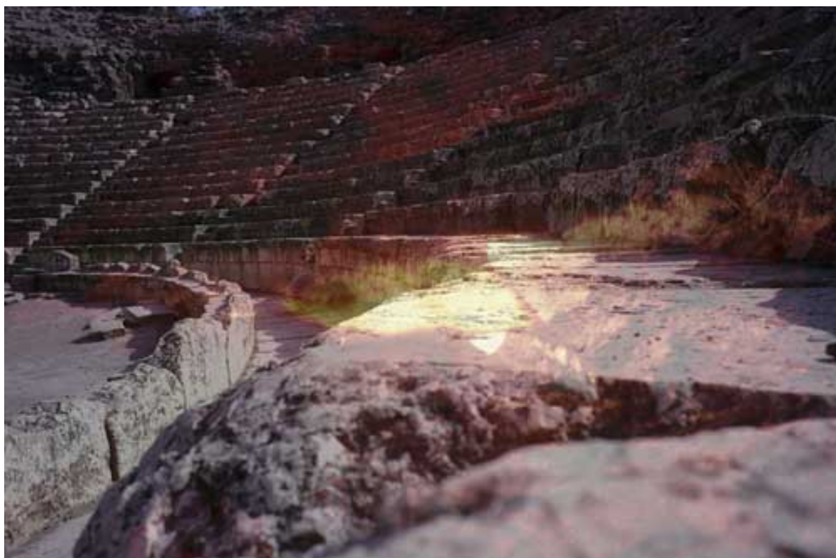
seq-2-24-dia Martyrs

Dans ce choix pour ou contre la religion des Grecs, les revers de l'histoire n'allaient pas tarder à mettre Israël au pied du mur. Les Grecs de Syrie supplantèrent ceux d'Égypte à la tête d'Israël. Ils imposèrent leurs coutumes , le Temple était pillé, l'idole y était installée et nos [Référen-ciel]