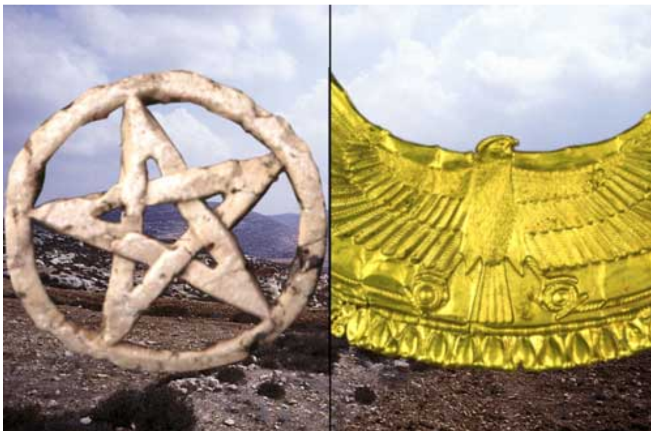
sq-2-19-Troisième Isaïe

Et puis Cyrus était venu, comme on s'y attendait, entré à Babylone, conviait les prisonniers à retourner chez eux, à rebâtir leur Temple . Le salut était là. Mais était-on délivré par le bras de " class="">YHWH ou renvoyé chez soi pour fournir au vainqueur le pain de ses armées en route pour l'Égypte ? On avait beau se dire que Cyrus pour un temps, remplaçait la souche de David, qu'il fallait avec lui rebâtir le pays, le zèle n'y était pas. À trop s'illusionner, la foi se décourage. Et puis, on retournait chez soi sans gloire comme au sortir de prison, on retrouve les siens, devenus étrangers et hostiles. Ils avaient fait de nous les bannis de l'exil, ceux qui étaient pécheurs puisqu'ils étaient punis. Malgré tout deux sceptres s'imposèrent, celui du gouverneur et celui du grand prêtre. Les prophètes Aggée et Zacharie s'attachaient à fonder leur pouvoir et l'on se remettait lentement à rebâtir un temple, mais que tout semblait vide ! En lisant Isaïe , on se mettait à transposer en rêve ce qu'avec trop de